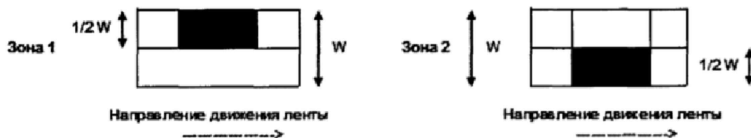
Рисунок 1 — Расположение испытательных нагрузок для СИ, осуществляющих взвешивание динамически

зона 2 — от центра грузоприемного устройства к противоположному краю транспортной системы.